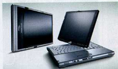
Tablety Fujitsu Siemens Stylistic v kombinaci s inteligentními formuláři 602XML usnadní práci uživatelům v terénu.